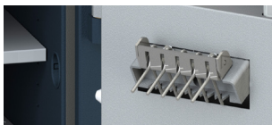
Kit antipesca Anti-fishing kit Kit anti-pêche